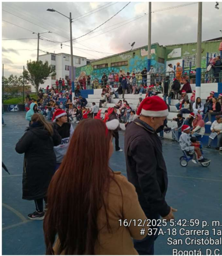
16/12/2025 5:42:59 p. m. # 37A-18 Carrera 1a San Cristóbal Bogotá, D.C.