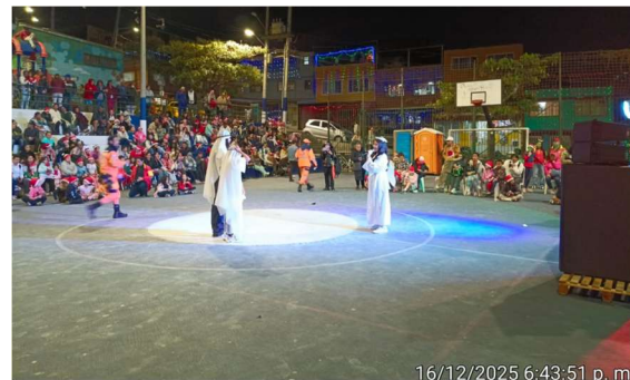
16/12/2025 6:43:51 p. m.