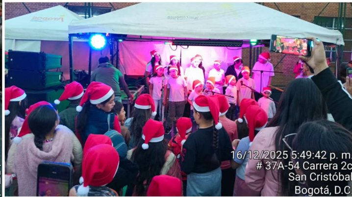
16/12/2025 5:49:42 p. m. # 37A-54 Carrera 2c San Cristóbal Bogotá, D.C.