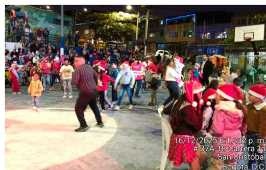
16/12/2025 6:17:32 p. m. # 37A-18 Carrera 1a San Cristóbal Bogotá, D.C.